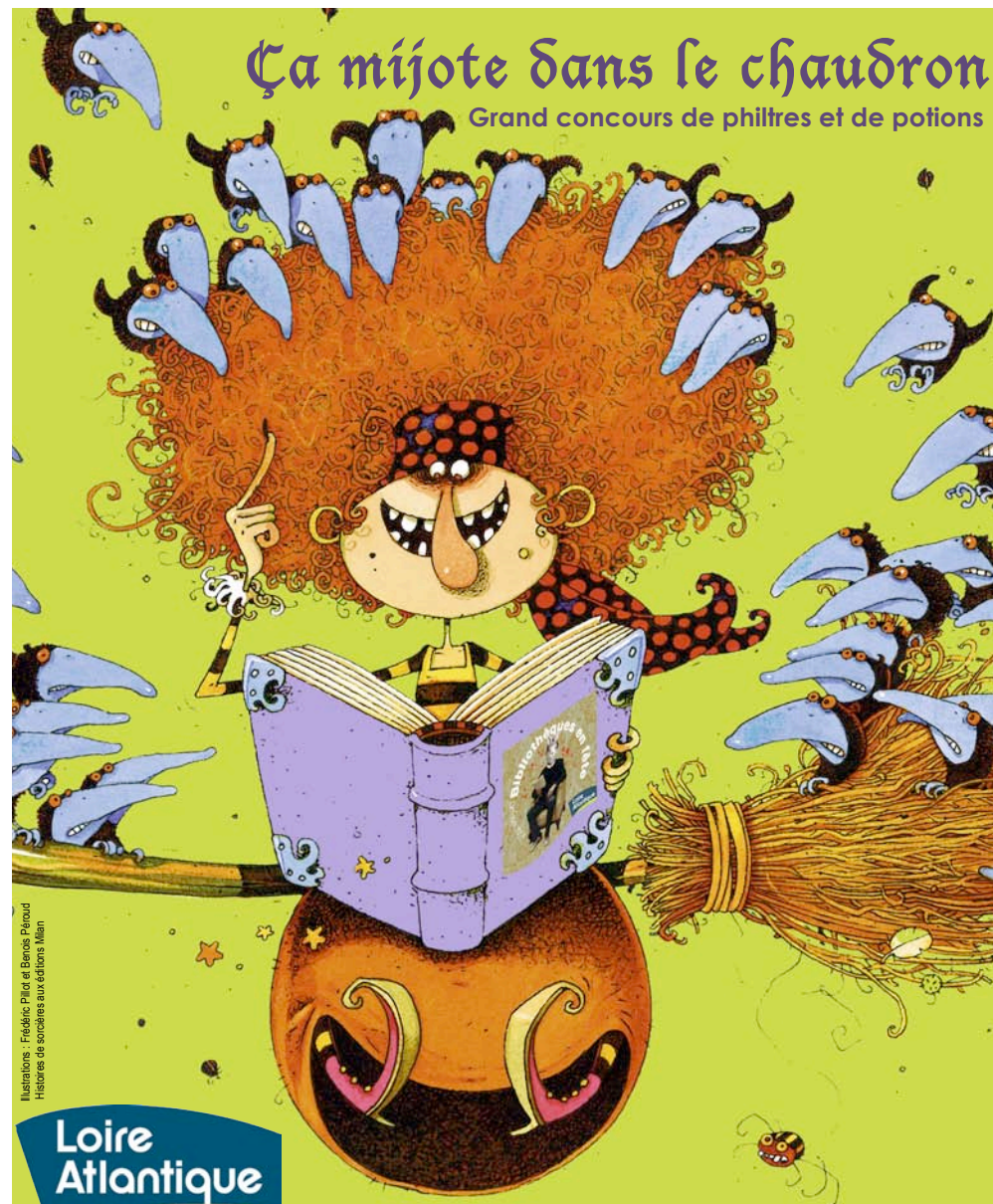
Illustrations : Frédéric Piller et Benoît Péroud Histoires de sorcières aux éditions Miam